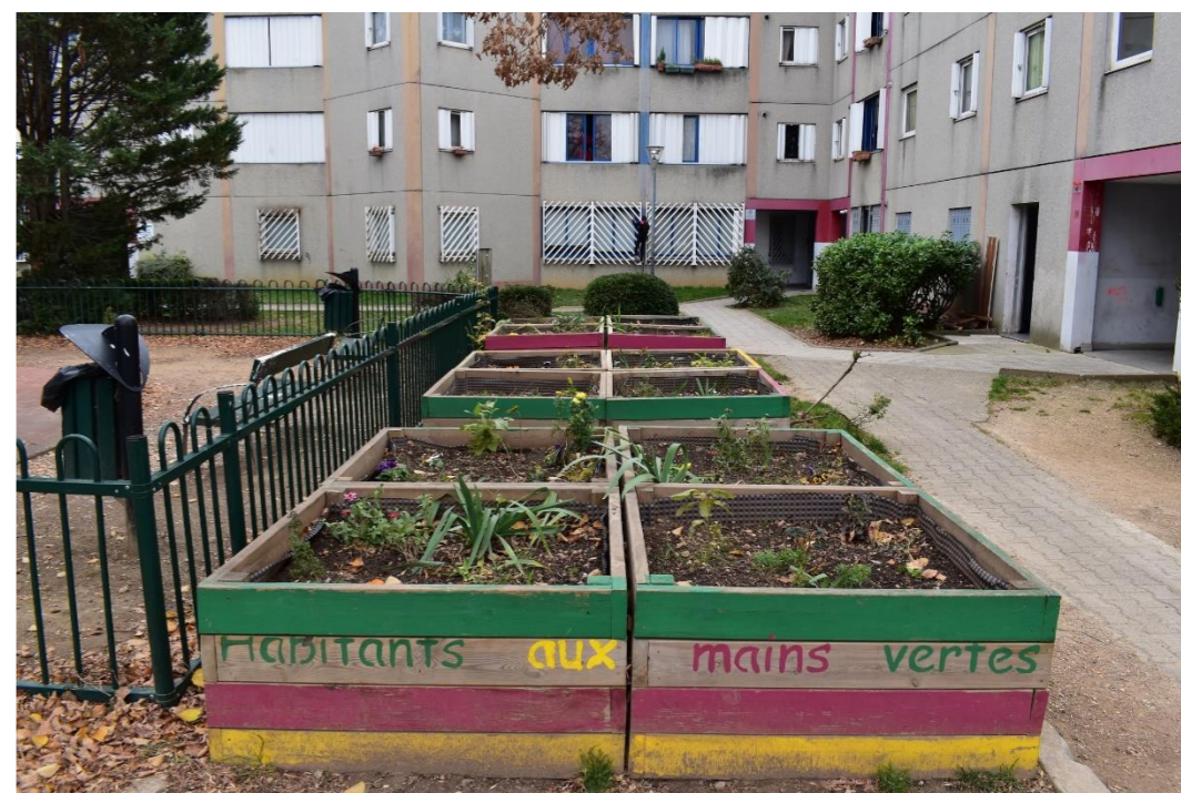
Street gardens in Saulaie (Oullins)