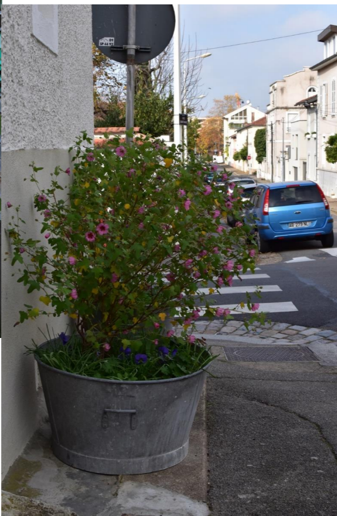
Street garden Montchat