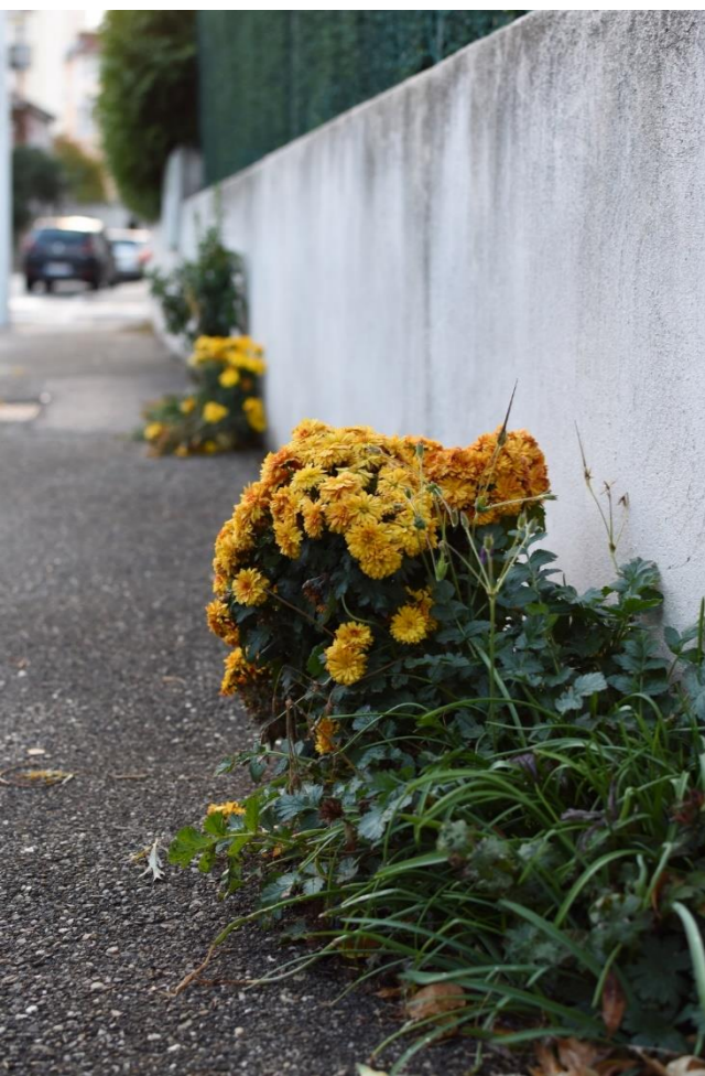
Street garden Montchat