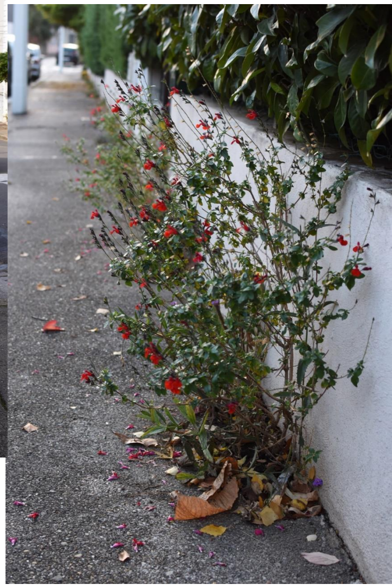
Street garden Montplaisir