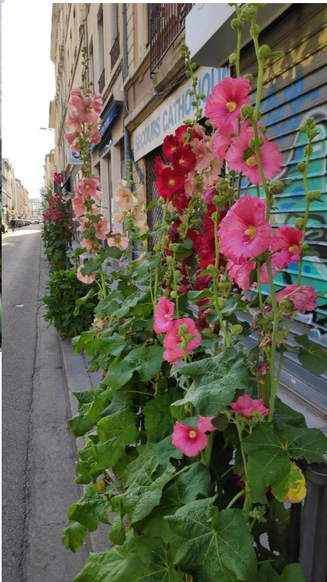
Street garden Paul Bert