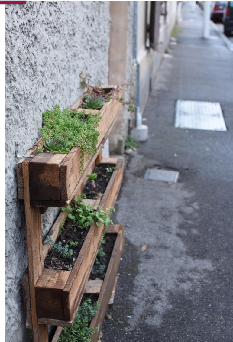
Jardinières de rue, 3ème