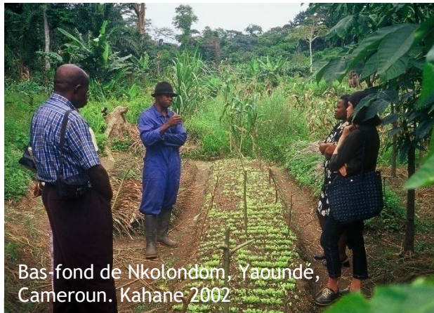
Bas-fond de Nkolondom, Yaoundé, Cameroun. Kahane 2002

Colloque international "Transitions 2021 - Les transitions écologiques en transactions et actions"