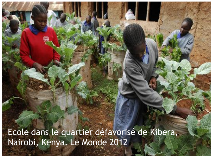
Ecole dans le quartier défavorisé de Kibera, Nairobi, Kenya.