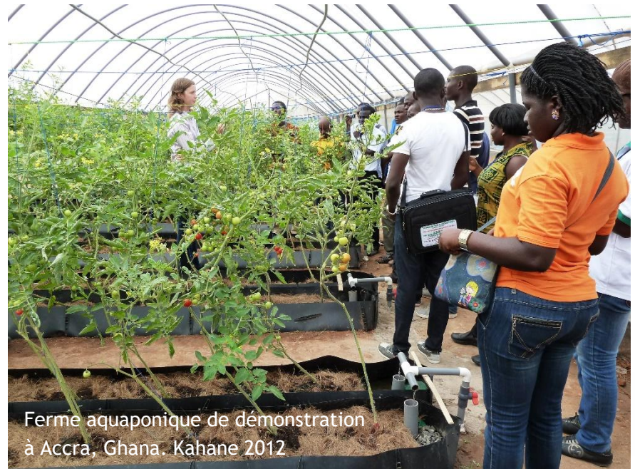
Ferme aquaponique de démonstration à Accra, Ghana. Kahane 2012