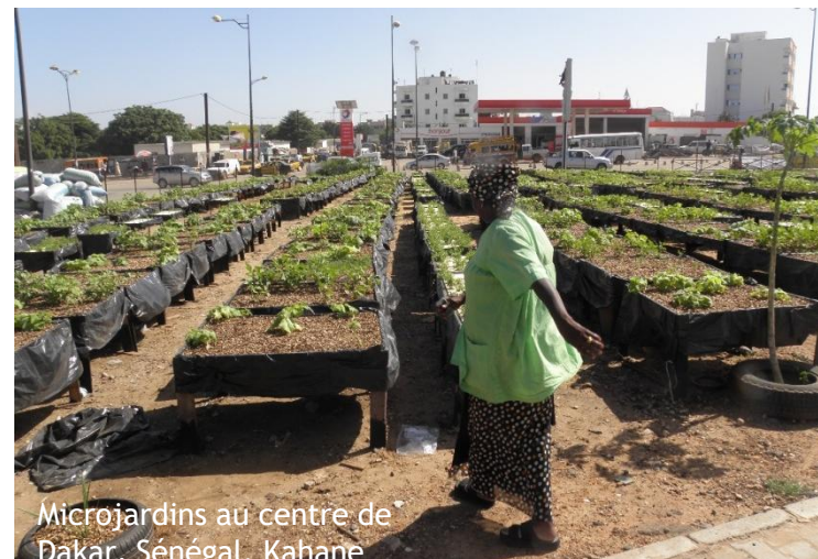
Microjardins au centre de Dakar, Sénégal. Kahane